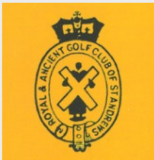
Das Kreuz des heiligen Andreas im Logo des R&A St. Andrews

Als Vorlage für das Club-Abzeichen des GCF diente bei der Gründung 1926 das Kreuz des Heiligen Andreas (St. Andrews), das seit jeher das Logo eines der ersten und ältesten Golfplätze der Welt „Royal and Ancient Golf Club of St. Andrews“ ziert. Dieses Andreas-Kreuz ist als Grundelement im Logo des GCF wieder zu finden. Die vier Grundfarben dokumentieren zum einen die bayerischen Farben weiß und blau, zum anderen die beiden Hausfarben weiß und schwarz der „K. und K. Donaumonarchie“ mit der dazu gehörenden ehemaligen bayerischen Prinzessin Elisabeth (Sissi) – die spätere Kaiserin von Österreich. Die ursprünglich runde Form des Abzeichens wurde in den vierziger Jahren abgewandelt und erhielt seine jetzige, endgültige Form.