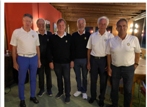
Herrenmannschaft AK50 II

Die Herrenmannschaft II konnte sich mit dem 3. Rang in der Tabelle den Klassenerhalt vor dem GC Tutzing und dem GC Oberstdorf in der Landesliga Süd 5 sichern.