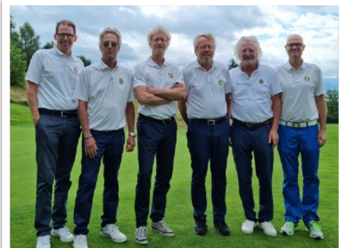
Herrenmannschaft AK50 I

Weniger erfreulich war das Abschneiden der 1. Herrenmannschaft in der Deutschen Golf Liga, die noch Punktgleich mit dem die Klasse erhaltenden 3. Tabellenplatz in den letzten Spieltag starteten. Die direkten Kontrahenten aus dem GC Domäne-Niederreutin erspielten sich allerdings mit +11 über Par den Tagessieg und der Mannschaft des GC Feldafing blieb mit +27 über Par nur der dritte Platz des Spieltages, der damit den Klassenerhalt nicht retten konnte. So muss die Mannschaft im Jahr 2022 in der Regionalliga starten und den Wiederaufstieg in die 2. Bundesliga anvisieren.