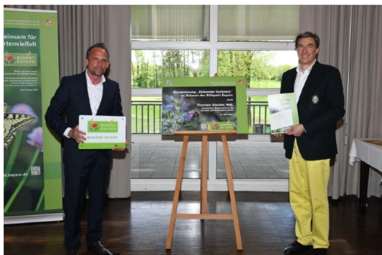
Bayerischer Umweltminister Thorsten Glauber und Präsident des GC Feldafing Nikolaus von Koblinski bei der Übergabe der Urkunde

Der Golf-Club Feldafing e.V. freut sich besonders über diese Auszeichnung, weil unsere Golfanlage mit ihren zahlreichen Umwelt- und Naturschutzprojekten nun erstmalig auf politischer Ebene in den Fokus der Öffentlichkeit tritt.