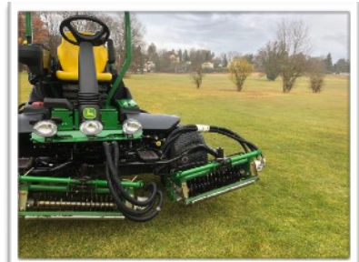
Neuer Triplex-Hybrid-Grünsmäher JD 2500

Der alte Caddy-Keller soll sukzessive modernisiert und den Brandschutzaufgaben angepasst werden. Ein erster Teilbereich im hinteren Bereich sowie der Flurbereich sind bereits mit neuem Boden und Elektroboxen ausgestattet worden. Durch die allgemeine Umstellung auf IP-Telefonie muss zudem die Telefonanlage des GC Feldafing modernisiert werden.