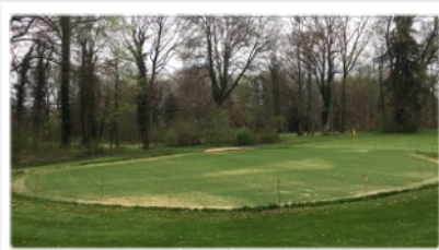
Grün 9 am 11.04.2017

Um die diesjährigen Verbandswettspiele der Mannschaften im GCF bestmöglich durchführen zu können, wurden die Heimspieltermine erst im Juli angesetzt. Bei den clubinternen vorgabewirksamen Turnieren wurden in der ersten Saisonhälfte vermehrt 9-Loch-Turniere eingeplant.