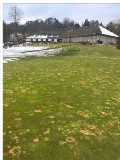
Grün 18 mit Schneeschimmel, 22.03.2018

Während die sanierten Grüns einwandfrei aussehen und kein Krankheitsbefall vorhanden ist, haben die restlichen Grüns nicht zu übersehende Schadbilder. Vor allem der Schneeschimmel wird die Grüns in den ersten Wochen des Frühjahrs noch begleiten.