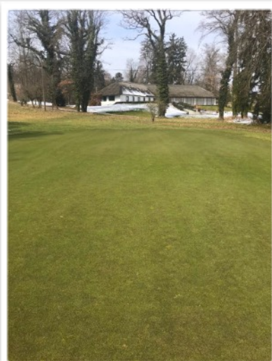
Grün 9 ohne Krankheitsbefall, 22.03.2018